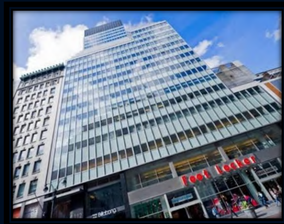
New York – USA