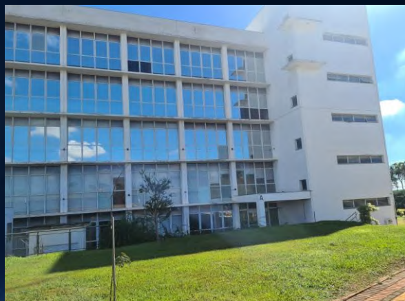
Unicamp – SP – BR