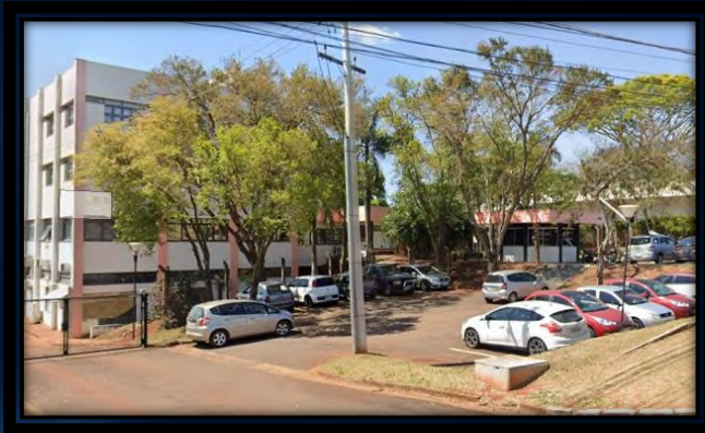
Unicamp – SP – BR